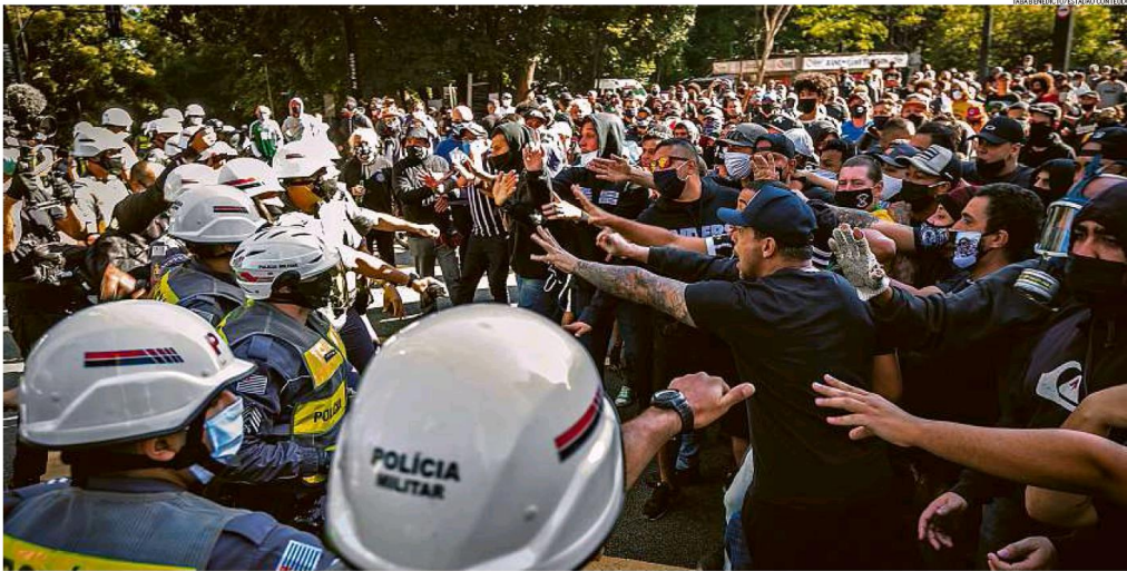
Organizada. Torcedores de Corinthians, Palmeiras e outros times se uniram num ato pró-democracia na Avenida Paulista, em São Paulo. Policiais militares separaram o grupo de uma manifestação de apoiadores do presidente Jair Bolsonaro

O domingo foi mais uma vez marcado por manifestações políticas mas, pela primeira vez desde o início da pandemia da Covid-19, grupos críticos ao governo ocuparam as ruas em oposição a manifestantes favoráveis a Jair Bolsonaro. Os novos atos, com gritos em prol da democracia, foram puxados por torcedores de clubes de futebol, como Corinthians, Flamengo e Palmeiras, a maior parte deles vestindo preto. Em São Paulo e no Rio de Janeiro, o encontro dessas novas vozes com os apoiadores de Bolsonaro e com a polícia levou a confrontos. Já em Brasília, as manifestações começaram na madrugada com o movimento 300 do Brasil, liderado pela blogueira Sara Winter, uma das investigadas no inquérito das fake news, acendendo tochas e entoando cânticos de guerra, em frente ao STF. Pela manhã, sem usar máscara, Bolsonaro se reuniu com apoiadores na Esplanada dos Ministérios. PÁGINAS 4 e 5