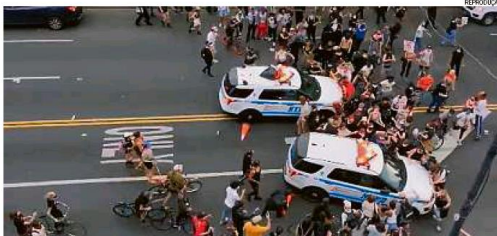
Carros da polícia avançam sobre manifestantes em Nova York, em mais protestos pela morte de George Floyd; 25 cidades declaram toque de recolher. PÁGINA 15